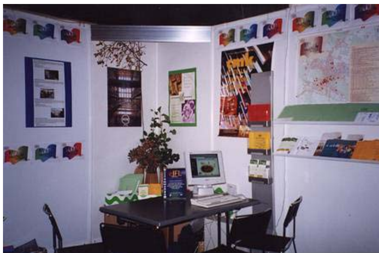
Slika 2: Razstavni prostor knjižnic Univerze v Ljubljani na Študentski areni 2001 v Cankarjevem domu, 16.–18. oktober 2001