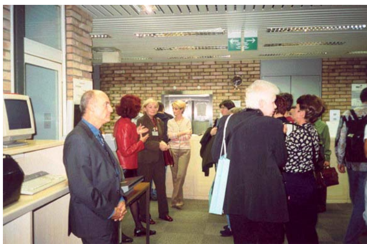
Slika 3: Obisk udeležencev 7. mednarodne konference IFLA – Interlending and Document Supply, 3. oktober 2001